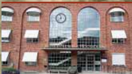
KTH, Campus Valhallavägen, 16 hissar