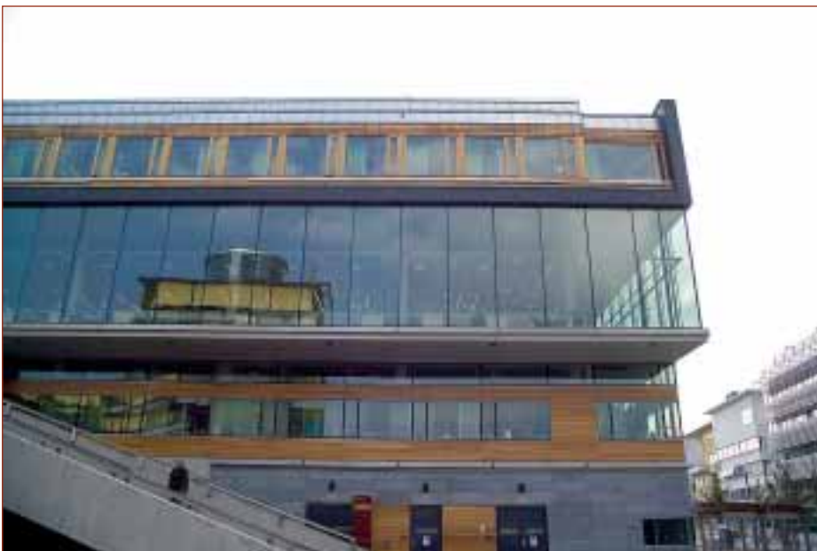
Södertörns Högskola, biblioteket. Två maskinrumslösa lindhissar Z-topp och två lindhissar med maskinrum.