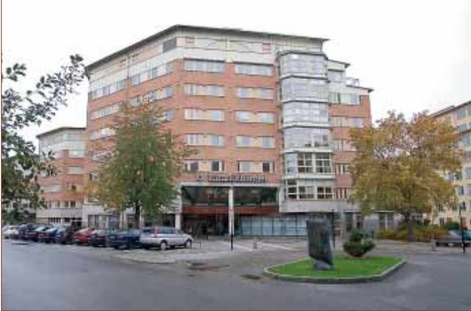
Lärarnas Hus. Totalt har ITK installerat och byggt om nio hissar.