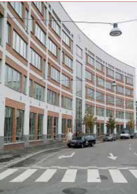
Sjöstadsskolan. Två maskinrumslösa linhissar (Z-topp) varav en med glasad hisskorg.

Vi finns och verkar i hela Storstockholm. Fler och fler företag väljer att låta ITK installera och underhålla hissarna i deras fastigheter. Vi tar det som ett gott betyg på att vi gör ett bra jobb och är en pålitlig partner under hela processen. På detta uppslag visar vi några pågående, eller i vissa fall avslutade, installationer vi gjort.