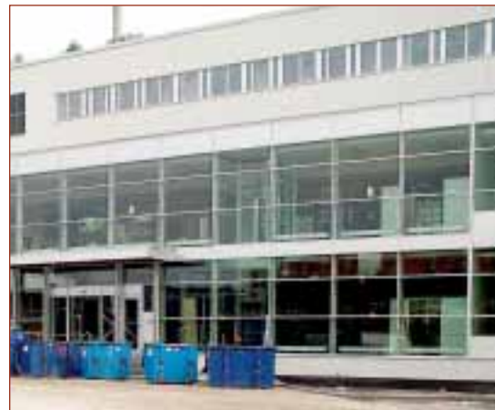
Södertörns tingsrätt. Sju maskinrumslösa lindhissar (Z-topp) varav en med glasad hisskorg.