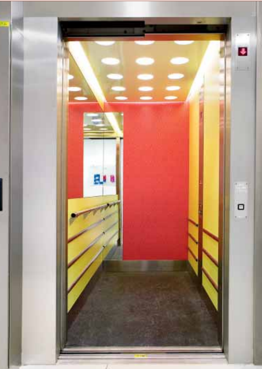
Arkitektbyrån Brunberg och Forshed har designat alla hissar på Campusområdet. I dialog med hyresgästerna har man låtit inredningen inspireras av 60-talsfärgsättning.

Ombyggnaden av Konstfacks gamla lokaler på Gärdet ska ge Stockholm ett nytt centralt Campus med inspirerande miljö. SIDA har redan flyttat in och sommaren 2007 är grannarna Naturvårdsverket och Teaterhögskolan på plats.