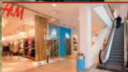
Nya hissar och ombyggnader i Gallerian