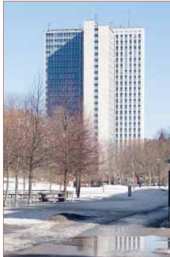
Studentskrapan, fd Skattehuset. Nio ITK-hissar i lågdelen, en speciell cykelhiss som går direkt från garaget var ett av de önskemål som fanns.