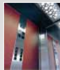
TYPGODKÄNDA HISSYSTEM Greenlift

Vi gratulerar I.T.K. till de 30 åren och önskar god fortsättning!