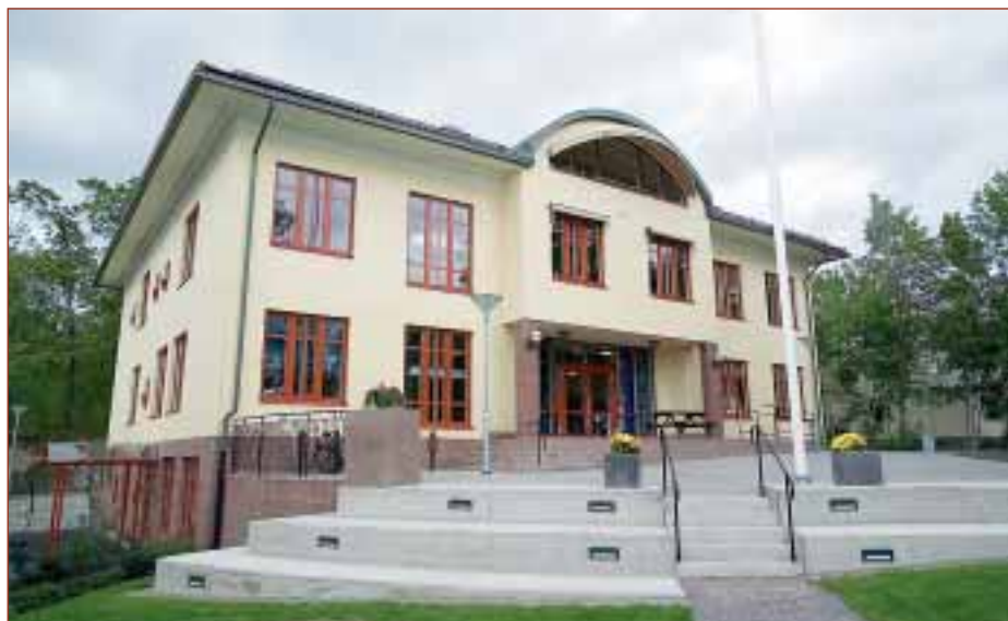
Marina Läroverket. En maskinrumslös linhiss med hisskorg i marint tema, mycket trä och mässing.

Vi finns och verkar i hela Storstockholm. Fler och fler företag väljer att låta ITK installera och underhålla hissarna i deras fastigheter. Vi tar det som ett gott betyg på att vi gör ett bra jobb och är en pålitlig partner under hela processen. På detta uppslag visar vi några pågående, eller i vissa fall avslutade, installationer vi gjort.