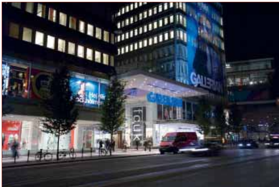
Gallerian på Hamngatan i Stockholm renoverades 2003/2004. ITK levererade ett flertal hissar samt genomförde både rivningar och moderniseringar.

Genom ombyggnaden ökade Gallerians yta från 20 000 till 30 000 kvadratmeter. Samtidigt som Gallerian byggdes om fick grannen Sverigehuset från 1969 också en upprustning. Sverigehuset består av två kroppar, en lägre med kontor och en betydligt högre som vetter mot Hamngatan 27. I