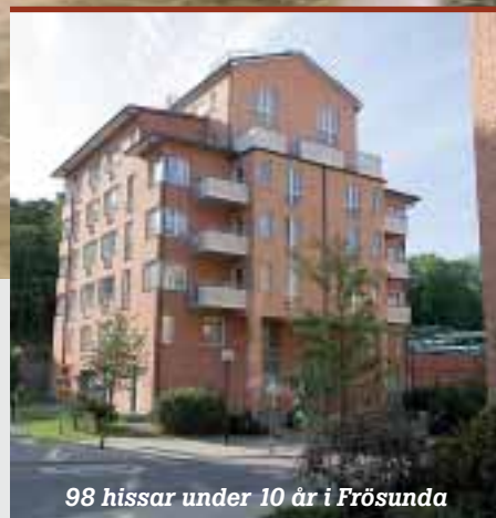
98 hissar under 10 år i Frösunda

En informationstidning utgiven av I.T.K.AB. Läs om aktuella projekt, vad några av kunderna tycker och lite historia om företaget.