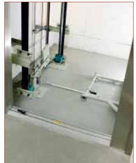
Maskinrumslös hiss med liten hissgröp, 300 mm djup, blev lösningen på Campus Gärdet.

Eftersom Sida och Naturvårdsverket är myndigheter ställs det höga krav på säkerheten i byggnaderna. När det gäller hissar