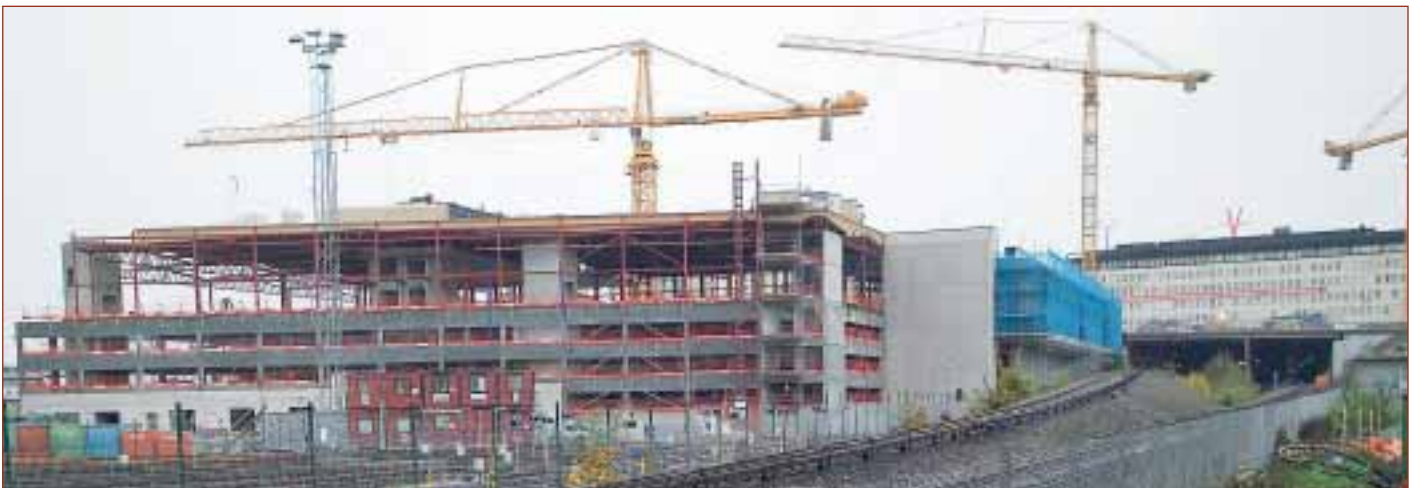
Vällingby Centrum. Volymhandel: Fyra lindhissar för 2.750 kg, tre hydraulhissar, två lindhissar för funktionshindre samt två mathissar. Modevaruhuset: Sex lindhissar och två hydraulhissar. Fler projekt på gång.