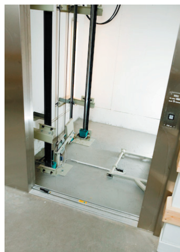
Hiss med 300 mm grop Campus gårdet, 10 hissar

Z-topp är en maskinrumslös linhiss som finns i olika utföranden, lämplig för nyproduktion och rotmarknaden. Den är dessutom möjliga att installera i befintliga hisschakt tack vare de flexibla måtten. Z-topp är typgodkänd för 300 mm hissgröp i befintliga fastigheter.