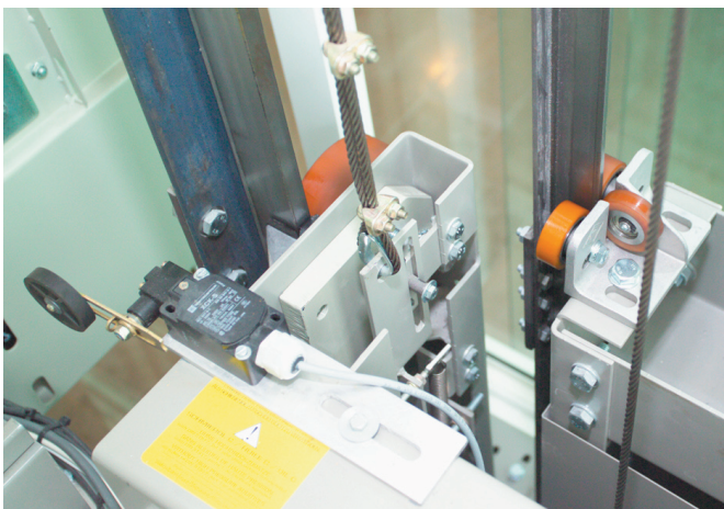
Rullstyrning på korg och motvikt