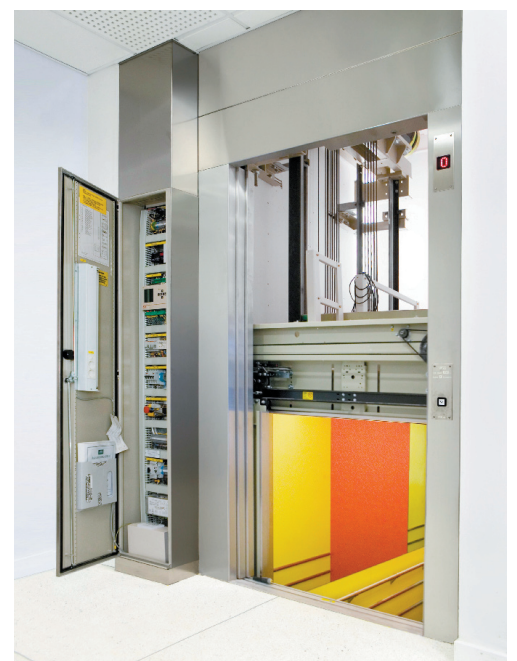
Hissens apparatskåp placeras normalt vid övre plan eller i anslutning till schakt

Z-topp kan levereras i halogen/PVC fritt utförande som i kombination med maskinens låga energiförbrukning ger bra miljöfördelar. Som standard levererar vi hissarna med glidstyrning men de kan också fås med underhållsfri rullstyrning. Hissarna är färdiglackade i beige, kan även fås i specialkulörter.