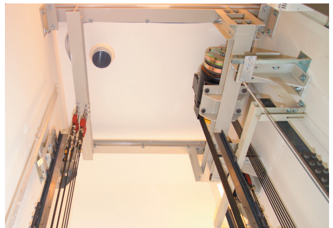
Schakttopp 2:1 utförande med gejder på varje sida