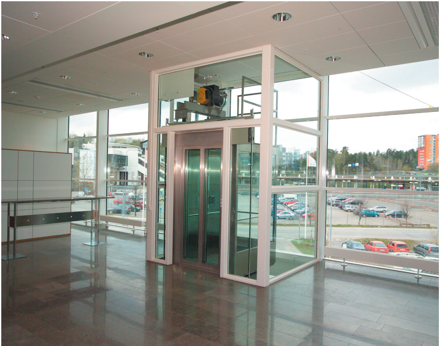
Z-topp med glasad korg installerad i Södertörns Tingsrätts nya fastighet

Z-topp är en maskinrumslös linhiss som finns i olika utföranden, lämplig för nyproduktion och rotmarknaden. Den är dessutom möjliga att installera i befintliga hisschakt tack vare de flexibla måtten. Z-topp är typgodkänd för 300 mm hissgröp i befintliga fastigheter.