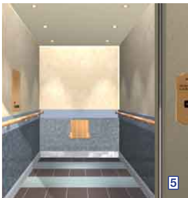
Dalablått - som berg och allmogefärg

Tak PP2010 ljusgrå • Rostfritt rampljus • Väggar: överdel marmor PP4842, nederdel granit PP 4826, röd bård och fälltsits PP4058 • Spegel halvvägg • Rostfri sockel, avbärare och handled • Golv granit 55 röd.