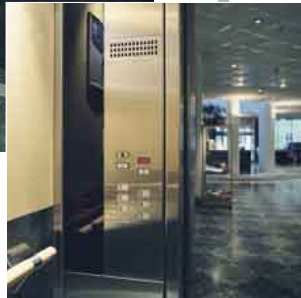
Radisson SAS Hotel - Malmö

Väggar med en kombination av laminat och björkfanér. Stengolv i färgton lika golvet i entehallen. Vålt tak med ljusramp runt väggarna. Handledare i bok. Spegel på bakväggen som följer formen på det vålva taket. Infällda downlights längs långsidorna.