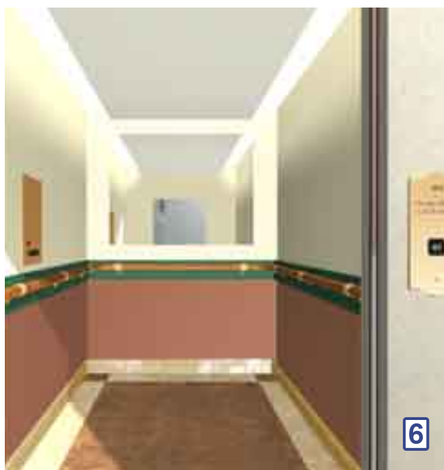
Varmt - som sol på en gammal tegelvägg

Tak PP1192 creme • Downlights 220V • Väggar: överdel PP5649 flammig, nederdel F5110 blå granit, blå bård F7884 • Fälltsits och handledare i bok • Rostfri sockel • Klinkergolv 989 svart och 974 blå.