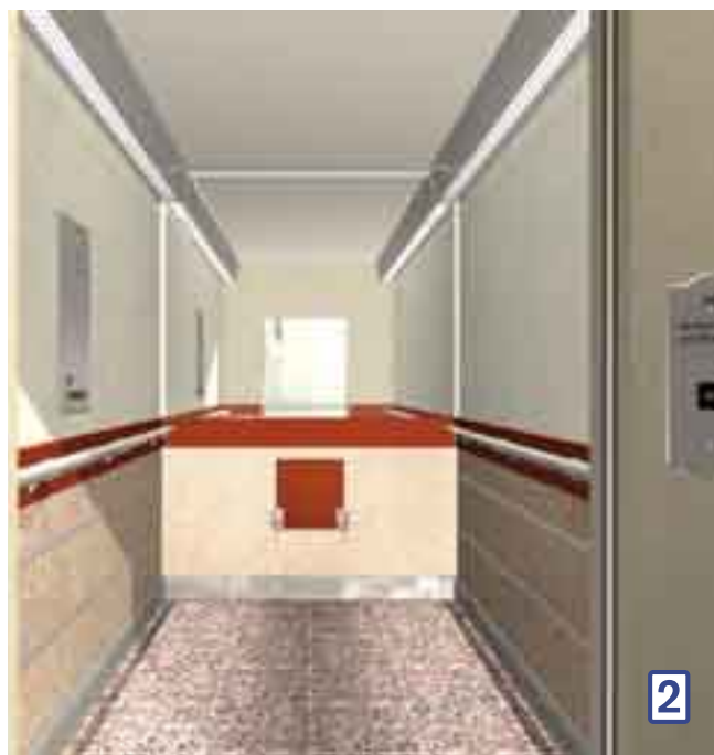
Elegant - med värme

Tak PP1192 creme • Downlights 12V • Väggar: överdel bok PP7016, nederdel alrot F1118 • Spegel halvvägg • Fälltsits och handledare i bok • Mässingslist och sockel • Golv granit 56 svart.